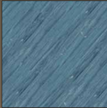
Malibu blue COL 03