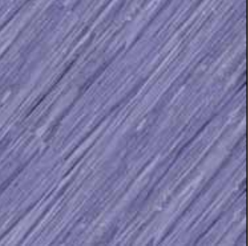
Violetta COL 14