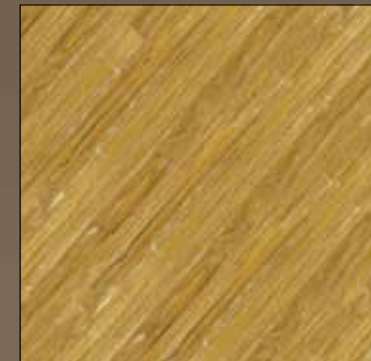
Citrus yellow COL 08