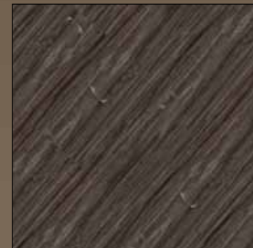
Dark Rum COL 06