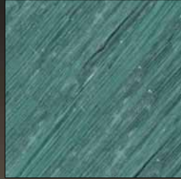
Mint leaf COL 09