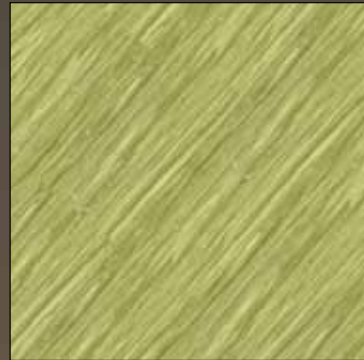
Lime green COL 10