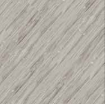
Soda COL 13