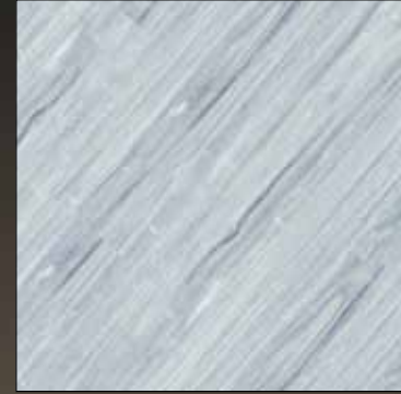
Crushed ice COL 11