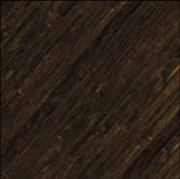
Cinnamon COL 16