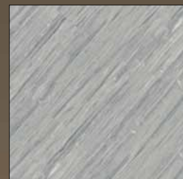
Ice grey COL 18