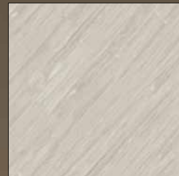
Mineral COL 05