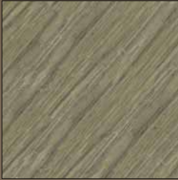
Sugar grain COL 02