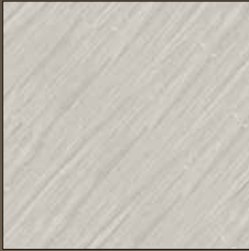
Cocktail glass COL 01