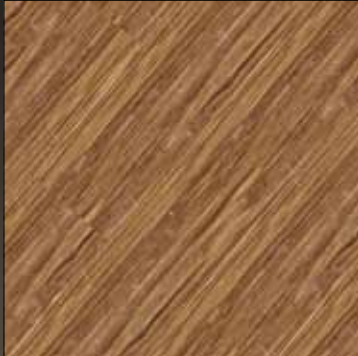
Cane sugar COL 15