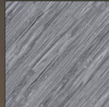
Spoon grey COL 12