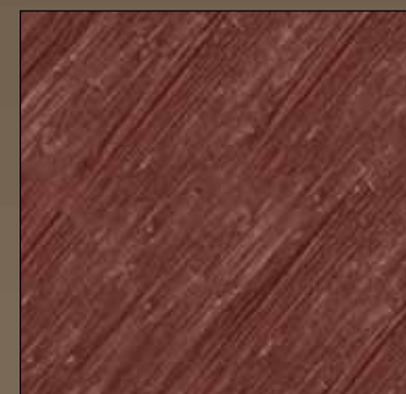
Cranberry red COL 17