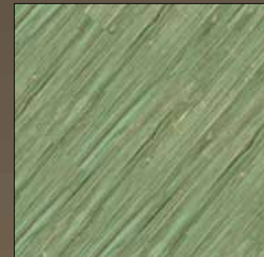
Spearmint COL 07