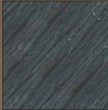
Shaker grey COL 04