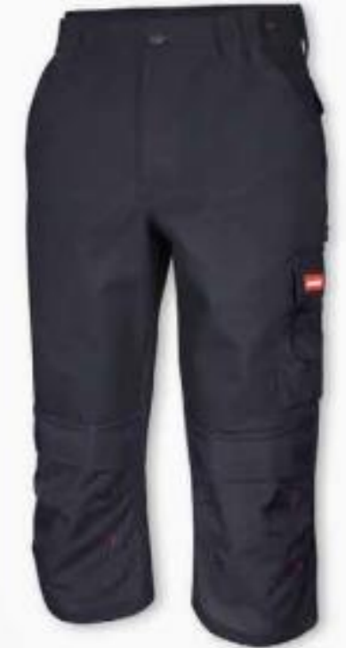
Farbe 000D schwarz