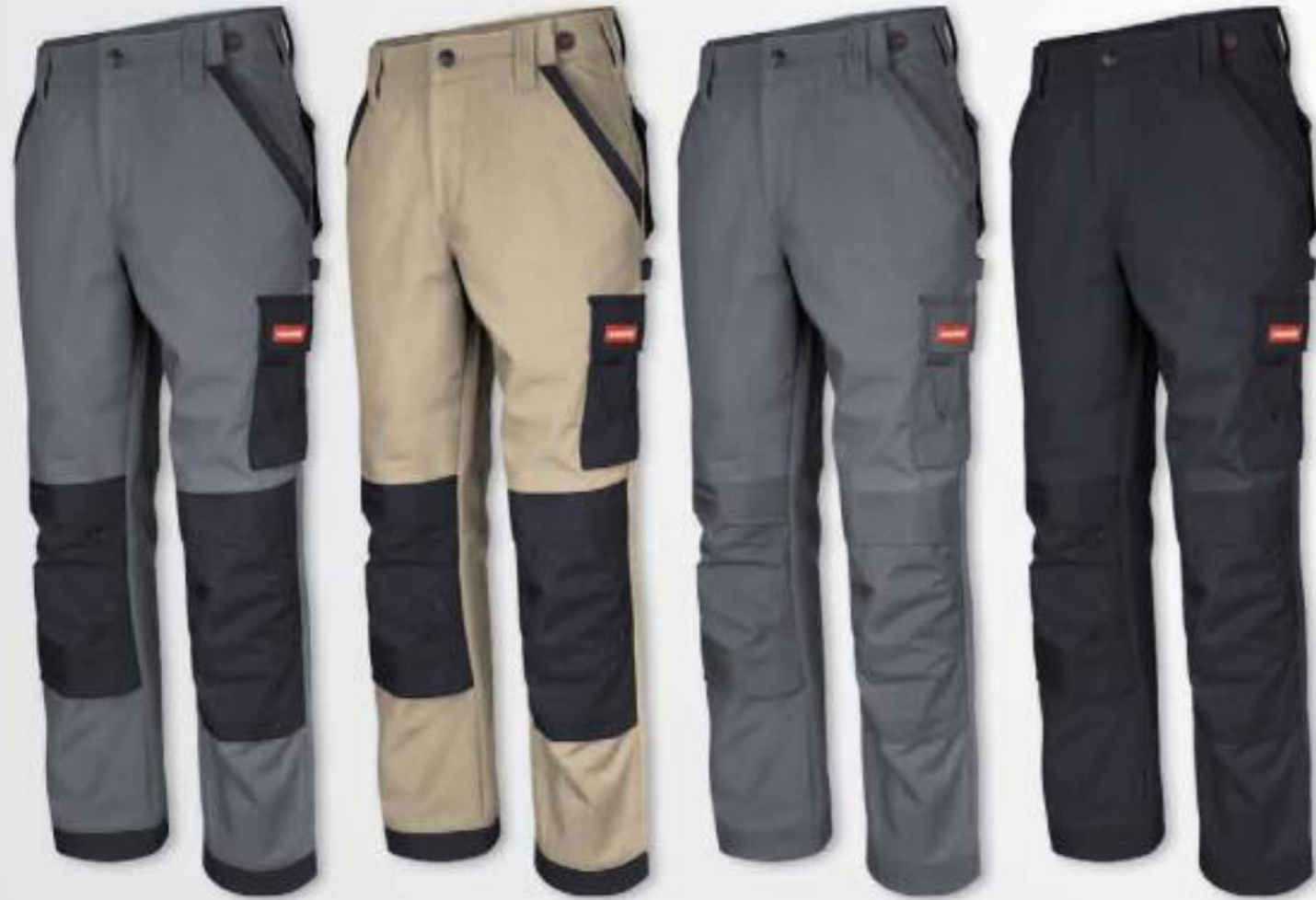
Farbe 262D grau/schwarz