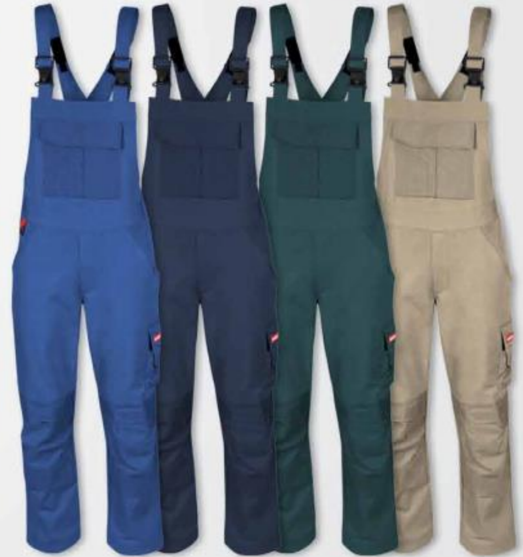
159 kornblau 037 dunkelmarine 214 dunkelgrün 096 khaki