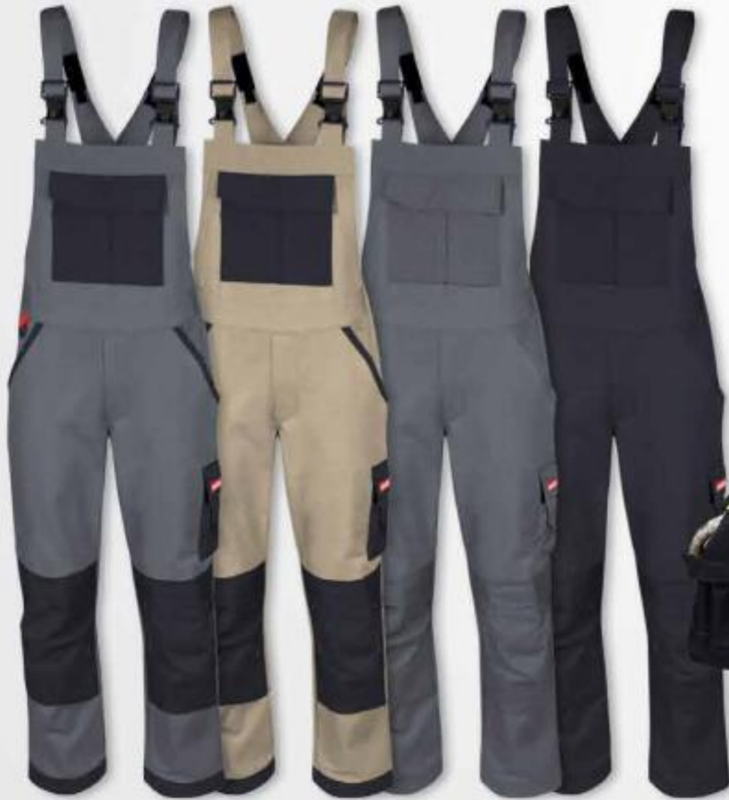
Farbe 262D grau/schwarz 293 khaki/schwarz 698 dunkelgrau 000D schwarz