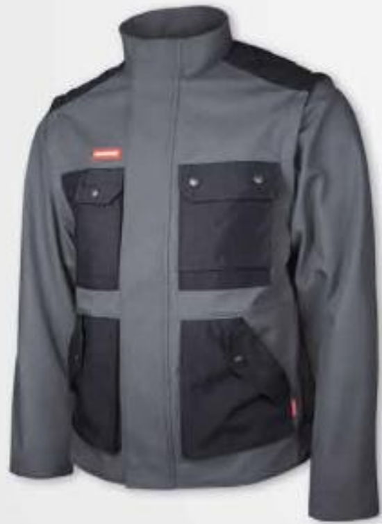
Farbe 262D grau/schwarz